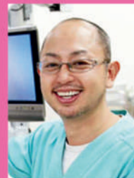
医療法人ジニア ぱんだ歯科 (愛知県北名古屋市開業)

会場 アットビジネスセンター 横浜西口駅前 602 号室 〒220-0004 横浜市西区北幸1-8-4 日土地横浜西口第二ビル6階 (受付は5階になります。)