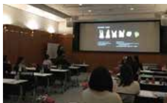
各部位ごとの特徴を学び器材の選択や注意すべきポイントを確認してからSRPの手技へとうつります。