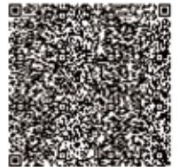
松風東京支社 グーグルMAP URL