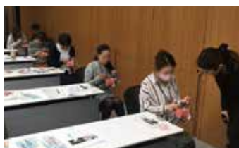
キュレット実習ではマネキンや抜去歯牙を用いています。持ち方等の基礎的な事から確認しますので、初心者の方も大歓迎です。