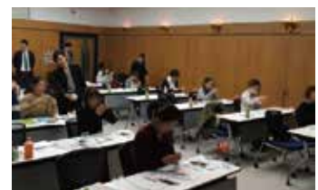
刃物の管理はとても重要です。シャープニングを習得していつでも万全のコンディションでSRPに臨みたいですね。